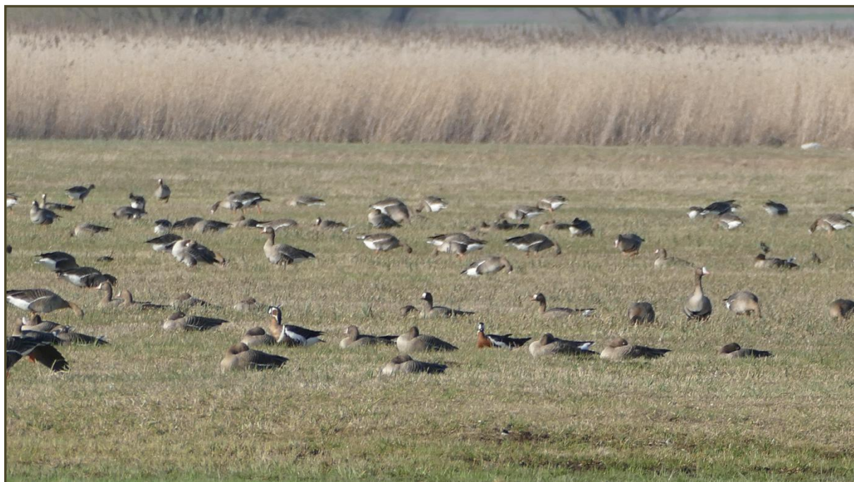
bernikle rdzawoszyje w Złakowie Kościelnym

gęś tybetańską, bernikle rdzawoszyje - stadko 10os., gęś krótkodziobą, bernikle białolice - stadko 42 os., błotniaka stepowego, kurhannika, sokoły wędrowne, orła przedniego, kuliki