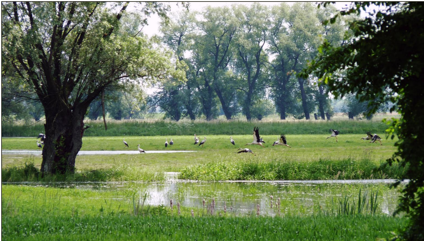
Rozlewisko Słudwi i żerujące bociany

Jakby wbrew tym przeciwnościom, w dolinach zachowała się część cennych walorów przyrodniczych. Płaskie ukształtowanie terenu i liczne zadolenia, powodują wyjątkowo powolny spływ wody i tworzenie się w okresie wiosennym znacznych rozlewisk. Atrakcyjność ostoi podnosi zróżnicowanie roślinności (wodnej, bagiennej, łąkowej i szuwarowej), obecność licznych zarośli wierzbowych oraz kompleksów leśnych w strefie przydolinowej, będących ostoją zwierzyny i ptaków.