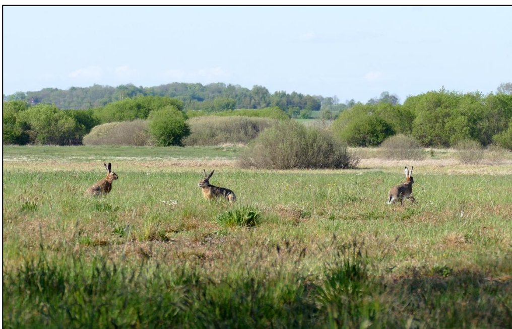
Zające pod lasem w Dolinie Przysowy

Ssaki nie są tu licznie reprezentowane. Można liczyć jedynie na pospolite zające, sarny, daniela, dziki, bobry, kuny, tchórze, norki, sporadycznie pokazują się jelenie i łosie (tylko w okolicy jeziora szczawińskiego występują licznie). Zaledwie jeden raz obserwowano rysia, który uciekł z puszczy kampsoskiej, a w ostatnim czasie pojedyncze wilki (zarówno w lasach od strony Gostynina jak też na łąkach od strony Bzury).