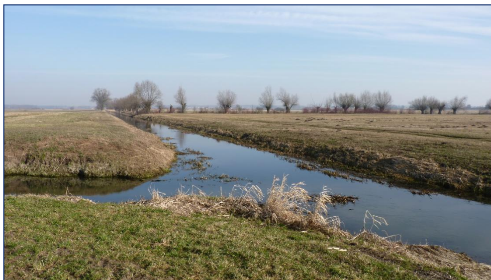
Styk Słudwi i Przysowy, okolice wsi Złaków Borowy.

Niejąko wbrew zdrowemu rozsądkowi, żeby pozbyć się wody, koryta rzeki Słudwi i Przysowy zostały prawie całkowicie wyprostowane. Aby dopełnić skali przyrodniczych nieszczęść, liczne