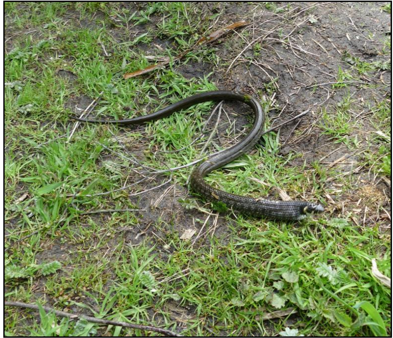
Zaskroniec przelkający żabę (okolice jez. Szczawińskiego)

Owady nie zostały należycie zinwentaryzowane. Do najciekawszych ich przedstawicieli należą: modliszka, pachnica dębowa, zmierzchnica trupia główka, zawisak powojowiec, trutniowiec, borodziej próchnik, kilka gatunków dzikich pszczół i motyli.