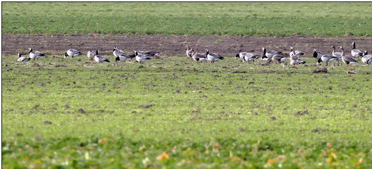
Bernikle białolice w Złakowie Kościelnym

Dolina Przysowy i Słudwi to nie tylko ptaki migrujące – to także teren istotny dla wielu lęgowych gatunków ptaków. Cenne gatunki gniazdujące na tym obszarze to m.in: