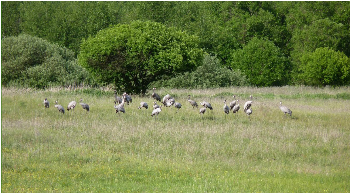
Żurawie na łące pod Rakowem

myszołowami włośchatymi. Amatorzy nocnych łowców mogą natrafić na gniazdujące pójdzki, płomykówki, puszczyki i uszatki. Duże zróżnicowanie terenu sprawia, że obok ptaków wodno-błotnych, możemy podziwiać gatunki zupełnie nie związane z wodą np.: żerujące w