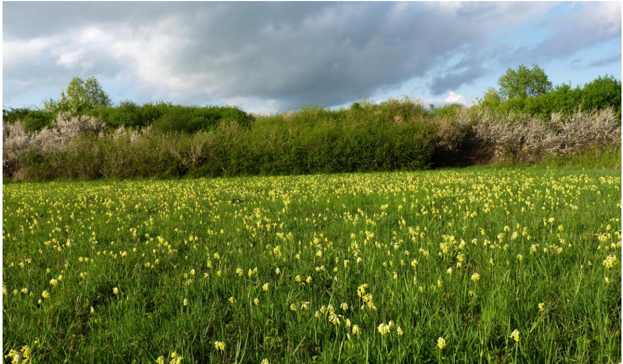
łąka porośnięta pierwiosnkami - we wsi Model.